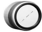
Rückstauklappe passend in Rohr