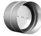
Rückstauklappe mit Nippel